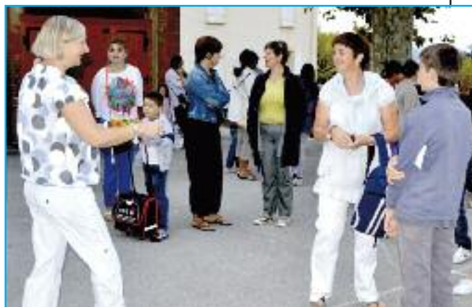
Rentrée école Saint-Maurice