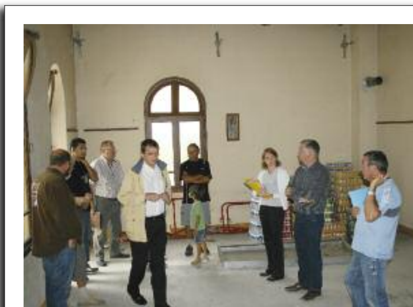
Réunion de chantier.

Sept corps de métiers (entreprises Reynier, Fournier, groupement 2000,