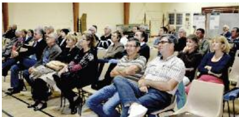
Public dans la salle.

Un dossier d'information et un registre d'observations restent à la disposition du public à la mairie.