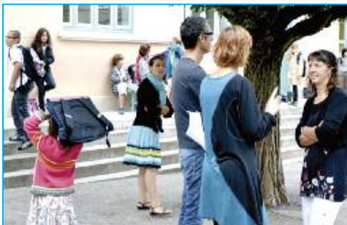
Rentrée école publique.