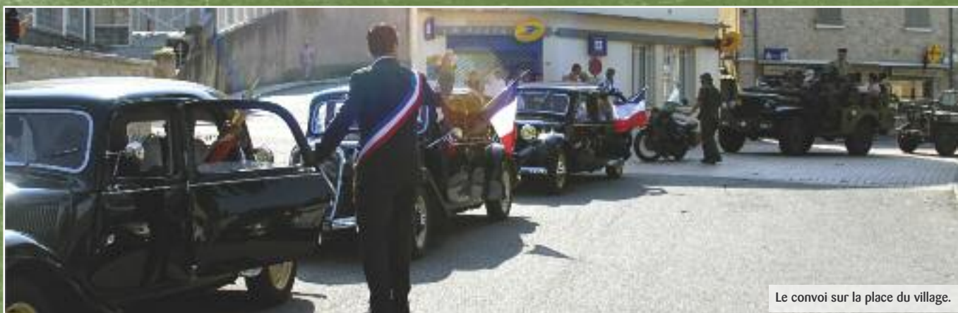
Le convoi sur la place du village.