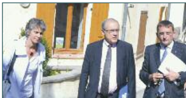
Lors de la visite des infrastructures de la commune.