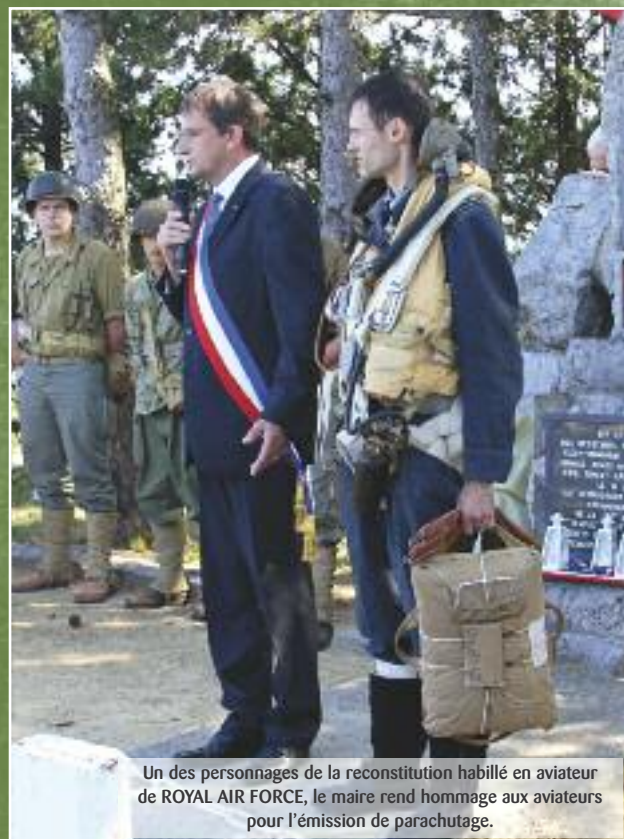
Un des personnages de la reconstitution habillé en aviateur de ROYAL AIR FORCE, le maire rend hommage aux aviateurs pour l'émission de parachutage.