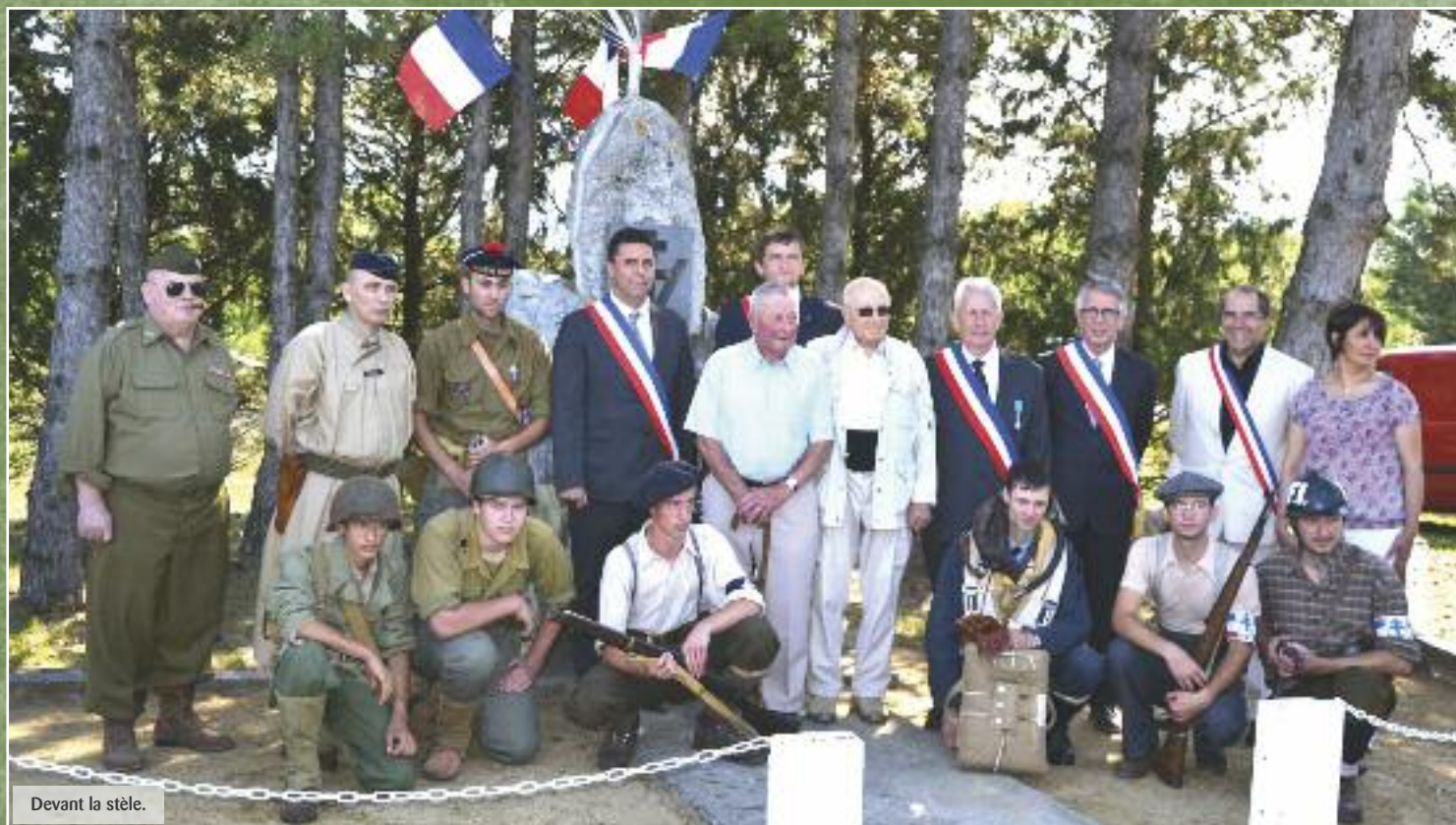
Devant la stèle.