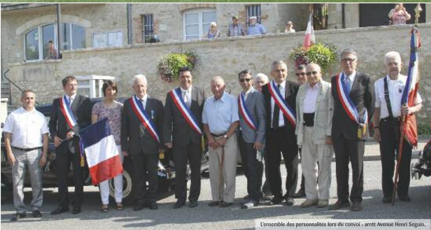
L'ensemble des personnalités lors du convoi : arrêt Avenue Henri Seguin.