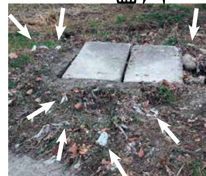
Les lingettes débordent des bouches d'égout.

Nous lançons un appel à votre responsabilité et votre civisme pour donner un écho favorable à cette information et à notre demande.