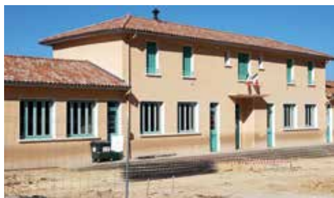
Travaux de la cour de l'école.

Dans l'ensemble, les travaux se sont déroulés dans de bonnes conditions. Nous sommes restés vigilants sur le respect du travail accompli et sur nos attentes envers les entreprises, chose un peu moins facile. Nous avons de très bons retours sur l'agrandissement de la cour.