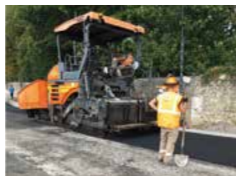
Mise en place enrobé sur plateau traversant rue des Bérangères et rue du Parc