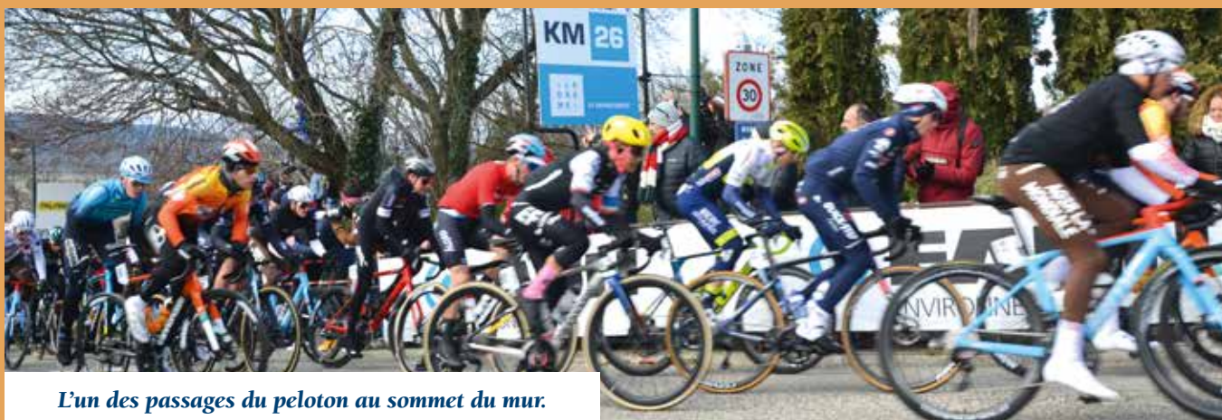
L'un des passages du peloton au sommet du mur.