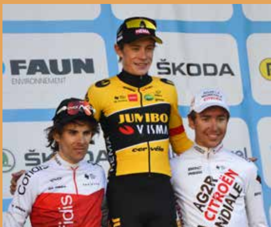
Le Danois Jonas VINGEGAARD, futur lauréat des Tours de France 2022 et 2023, vainqueur à Étoile de l'édition 2022 devant les Français Guillaume MARTIN et Benoît COSNEFROY.