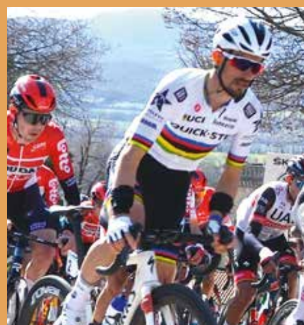
Un champion du Monde sur le mur d'Allex en la personne du Français Julian ALAPHILIPPE.