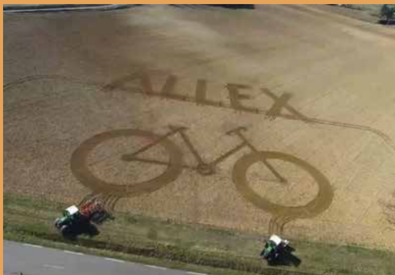
Notre campagne tout à l'honneur, vue d'hélicoptère (merci aux agriculteurs).