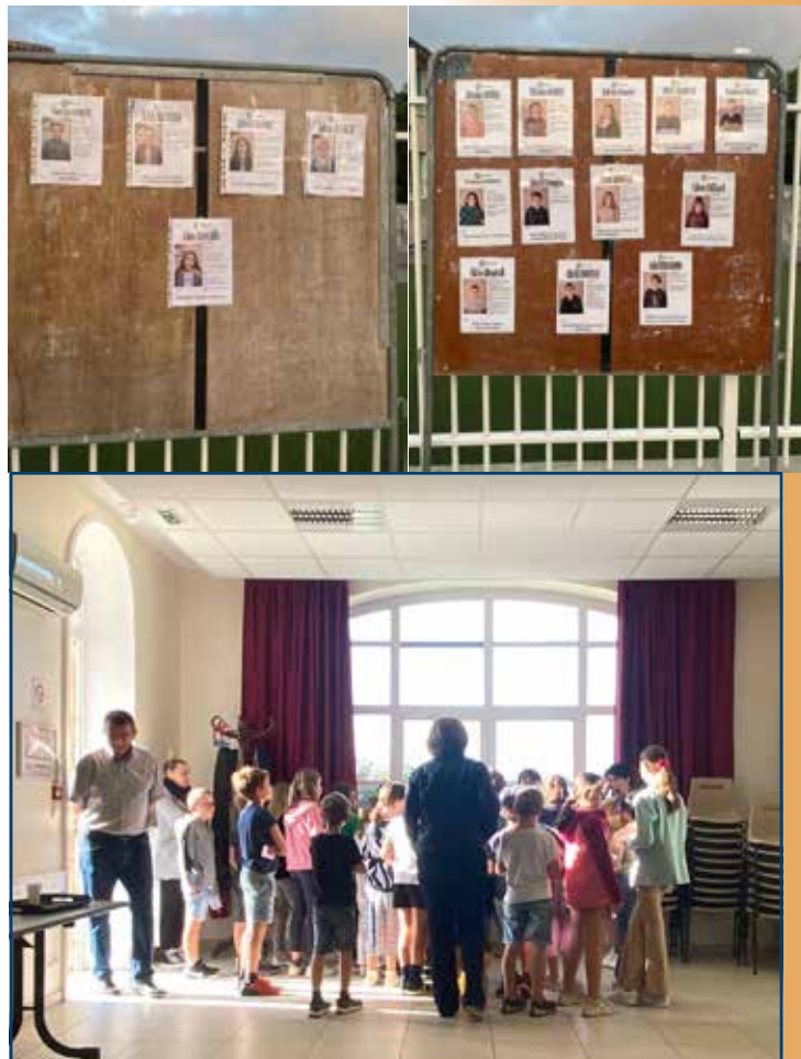
Le nouveau Conseil Municipal des Enfants 2023-2024

Un grand merci aux enseignantes des écoles, à l'ensemble des services de secrétariat et technique, aux élus du conseil municipal sans qui ce projet ne pourrait exister.