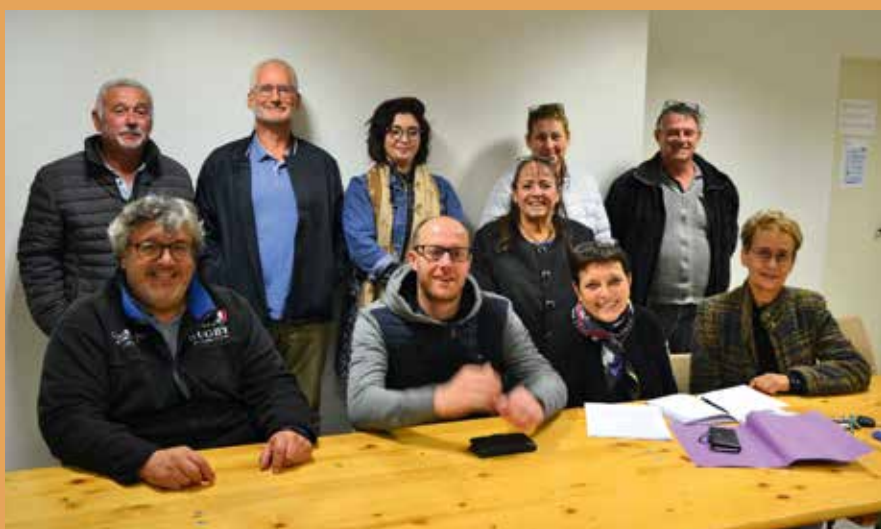
Les participants à la première réunion préparatoire.